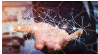
Mobility as a Service (MaaS)