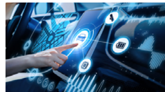
IKT für Elektromobilität