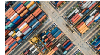
Transport und Logistik