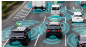
Automatisiertes und vernetztes Fahren