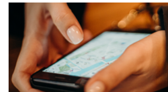
Ortung und Navigation

Der gemeinsame Messeauftritt stellt einen Ausschnitt der vielseitigen Themenbereiche dar, die im Wirtschafts- und Technologiestandort Deutschland bearbeitet werden.