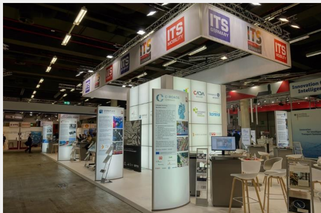
Der Gemeinschaftsstand beim ITS Weltkongress in Hamburg 2021

Egal, welche Form der Beteiligung Sie wählen, der Gemeinschaftsstand bietet Ihnen einen adäquaten Ort für Ihre Besucher:innen und Geschäftstätigkeiten.